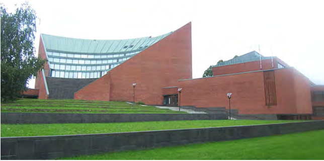
ポスターセッション会場Ⅰ：アアルト大学（オタミエミ）